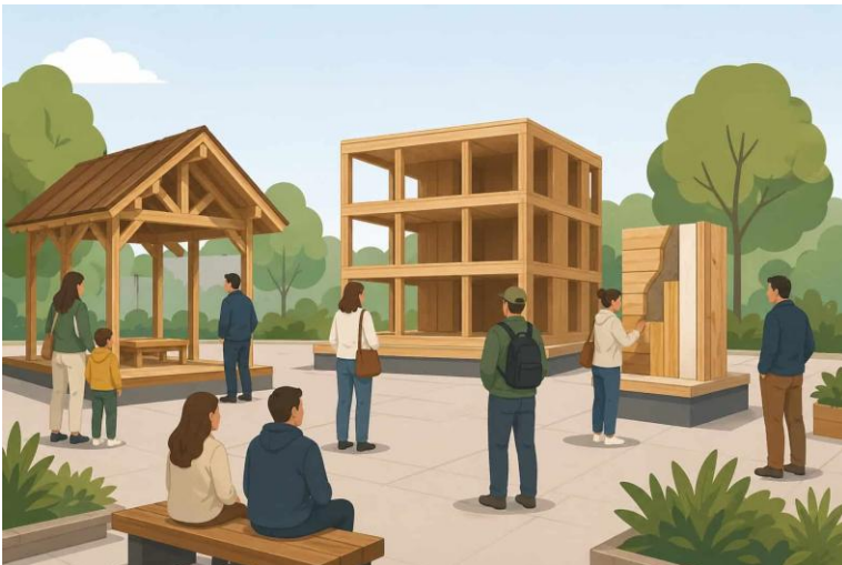
Vir slike: Umetna inteligenca Chat-GPT

Na spletni strani Ministrstva za gospodarstvo, turizem in šport je objavljen Javni poziv za sofinanciranje investicij iz Gozdnega sklada za izvajanje Promocije javnih demo lesenih objektov za leto 2026 (DEMO LES 2026) (v nadaljevanju: Javni poziv).