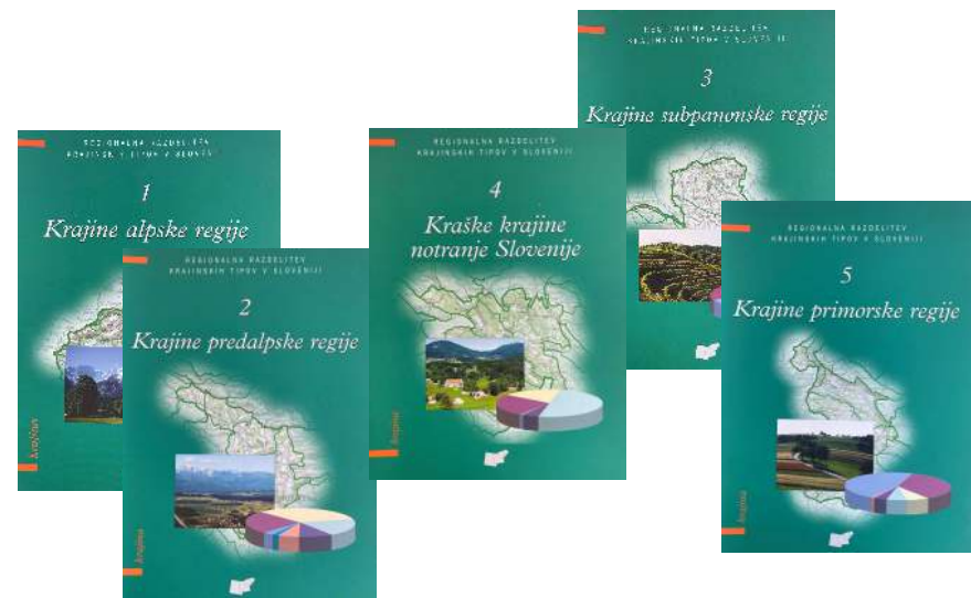
Regionalizacija krajinskih tipov Slovenije, 1998